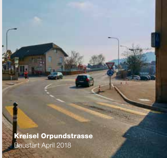
Kreisel Orpundstrasse Baustart April 2018

Anwohnerinnen und Anwohner, Geschäftsbetreiberinnen und -betreiber sowie Kundinnen und Kunden müssen während den Bauarbeiten mit Einschränkungen und Behinderungen rechnen. Gemeinsam mit der beauftragten Bauunternehmung Marti AG Bern danken wir Ihnen bereits heute für Ihr Verständnis.