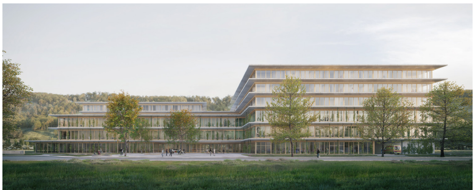
Visualisierung Spital Biel – Brügg, Steiger Concept AG, Zürich