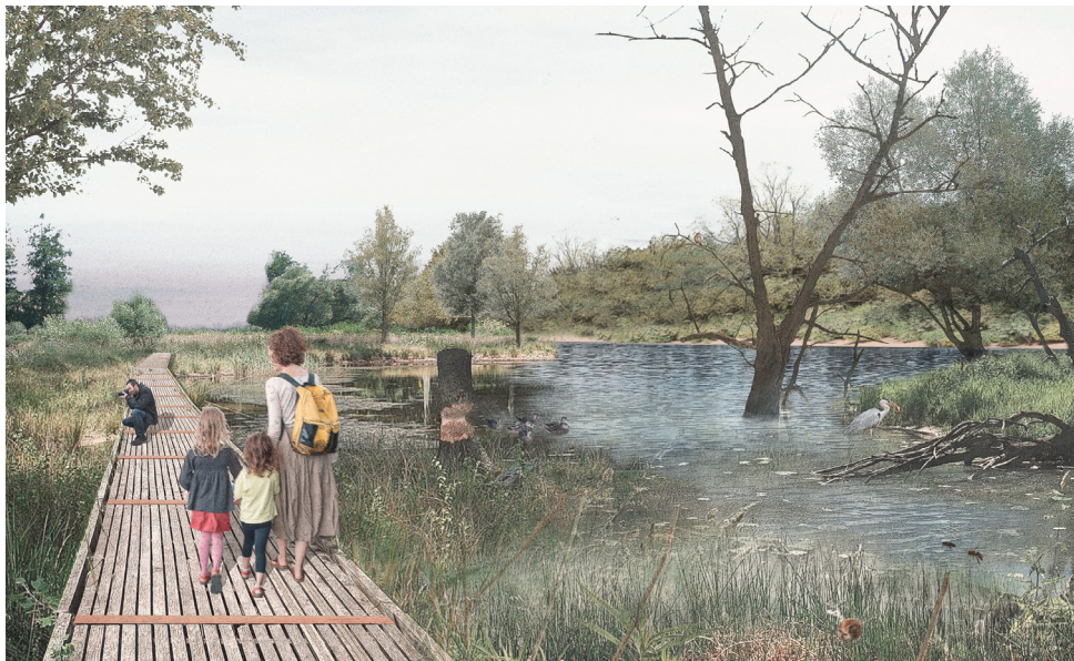
Visualisierung Landschaftsfenster B, MØFA Studio GmbH, Zürich