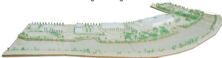
Modell Uferpark, MØFA Studio GmbH, Zürich

Am 10. September 2024 wird eine Informationsveranstaltung zur bevorstehenden Urnenabstimmung am 27. Oktober 2024 stattfinden. Dort werden die letzten wichtigen Informationen bereitgestellt. Es ist wichtig, dass sich die Stimmbürgerinnen und Stimmbürger über die Abstimmungsvorlage ein umfassendes Bild machen können. Die Stimmberechtigten werden über die Änderung des Zonenplanes abstimmen. Bei Zustimmung genehmigt der Gemeinderat im Anschluss daran die Überbauungsordnungen.